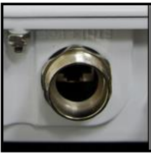
無線設備下方 PoE 乙太網路防水插孔

PoE 乙太網路供電器強供型 RJ-45 乙太網插孔，電源與資料載於網路線，供電給無線設備並進行資料傳輸。